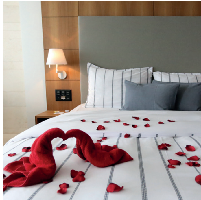
◀ Aussicht auf den Zürich-Obersee ▲ Romantisch dekorierte Junior Suite