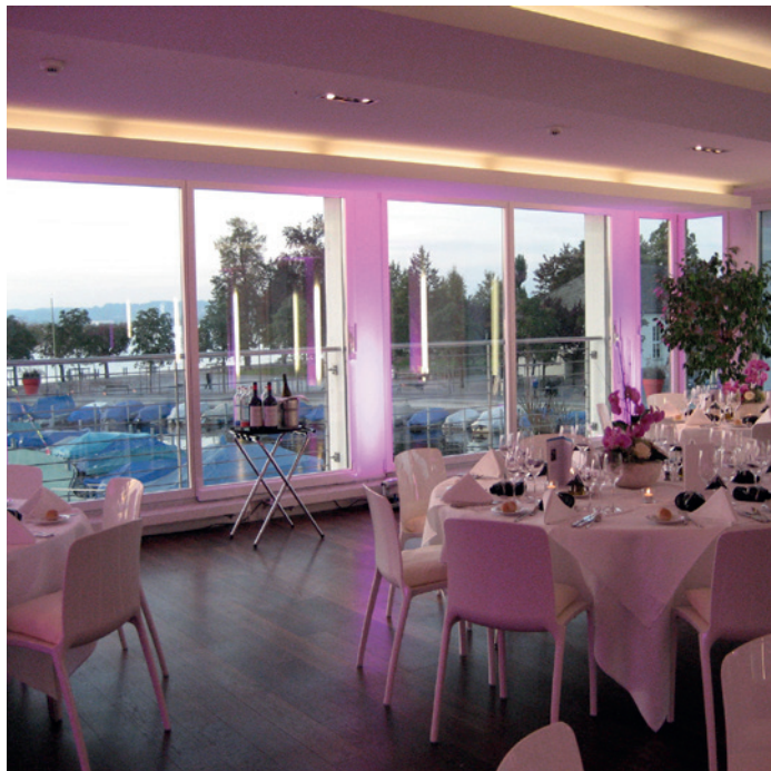
▲ Beleuchtung mit LED-Spots ➤ Runde Tische für bis zu 8 Personen